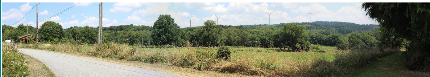
Photomontage du parc éolien de Chatenet-Colon